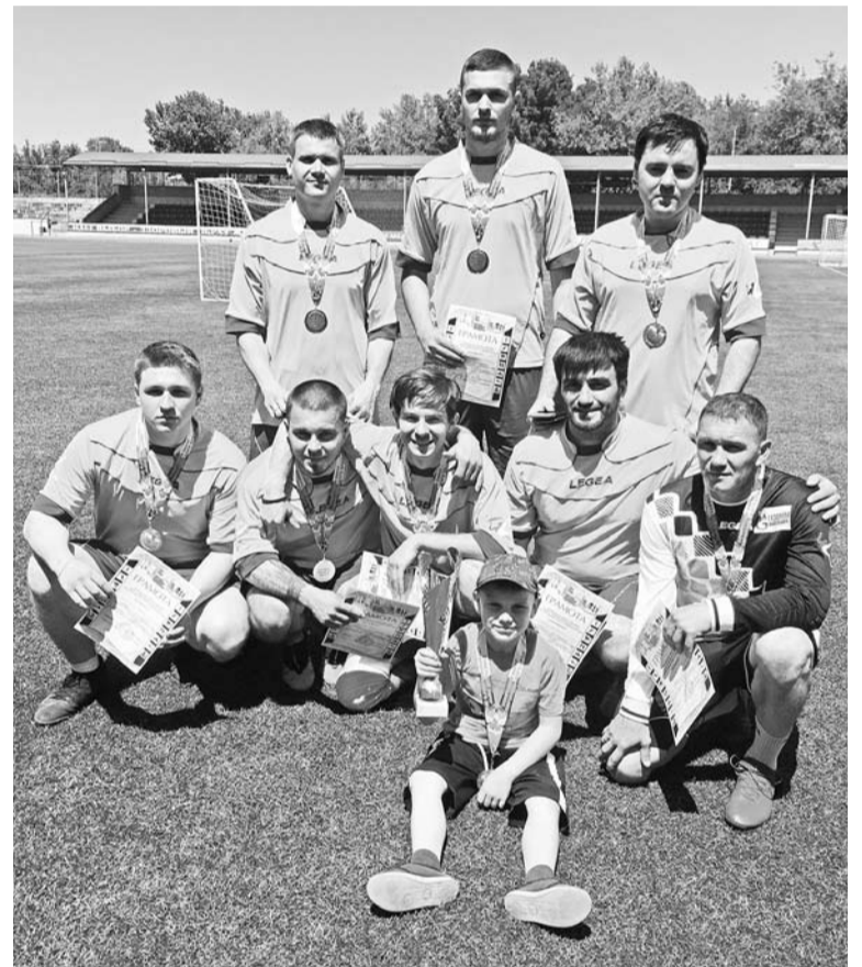
Футболисты городской команды-победителя и представитель подрастающей смены - сын капитана

Информацию и фото предоставил комитет по физической культуре и спорту администрации СГО