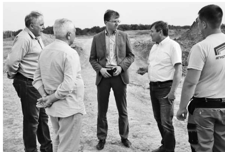
Министр сельского хозяйства посетил ЗАО СХП «Кавказ» в с.Солдато-Александровском

Губернатор также обратил внимание глав городов-курортов, где идут работы по созданию новых купальных зон. В проекты мест отдыха должны быть включены дежурные спасательные и медицинские пункты.