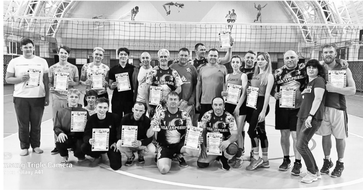
Участники турнира по волейболу «Кубок поколений»