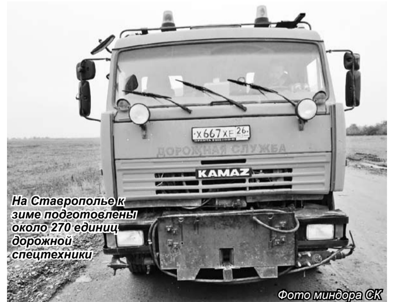
На Ставрополье к зиме подготовлены около 270 единиц дорожной спецтехники

Напомним, губернатор Ставропольского края неоднократно отмечал важность проведения мероприятий по подготовке дорожных служб к работе в осенне-зимний период, так как зачастую именно от своевременной реакции дорожников на те или иные изменения в погоде зависит безопасность всех участников дорожного движения.