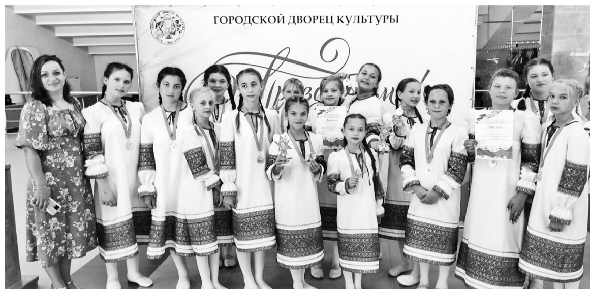
Хореографический коллектив «Казачок»

В минувшее воскресенье в Георгиевске прошёл VIII Всероссийский конкурс-фестиваль «Искусство длиною в жизнь...», посвящённый памяти заслуженного работника культуры РФ, обладателя премии в области хореографического искусства Ю.С.Левченко.