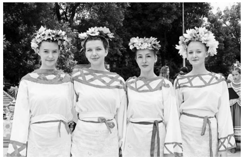
На площади рябило в глазах от ярких костюмов

Е. Масловская, заведующая художественно-постановочной частью социально-культурного объединения с. Солдато- Александровского