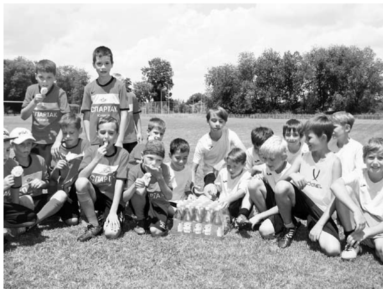
Юные футболисты тоже провели матч