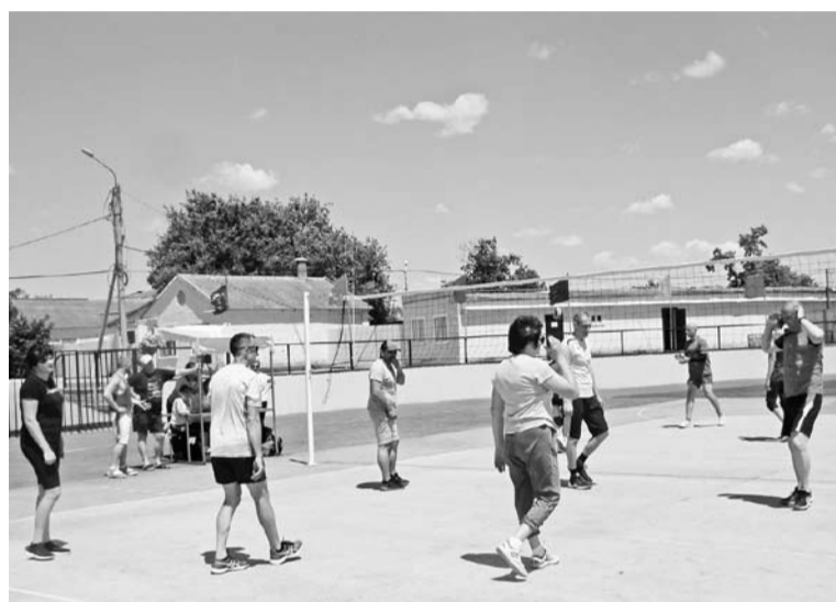
Силами мерялись опытные волейболисты

гур на досках, а другие гнули друг другу руки на столах для армрестлинга, рядом кипели волейбольные страсти. Соревновались три смешанные команды (мужчины с женщинами): две - «Молния» и «Здоровье» - из города и одна из с. Правокумского. Крики и падения на площадке красноречиво говорили о том, что силами мерялись опытные и сыгранные коллективы, победителем среди которых стала «Молния».