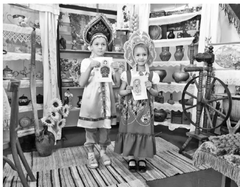
Уголок народного быта «Горница»

Усилиями двух библиотек с. Солдато-Александровского был организован библиокросс «Живая нить традиций». На старте гости узнали о традициях, обычаях, обрядах народов России, приняли участие в литературной мозаике «Пословица недаром молвится», составив из предложенных слов пословицы и поговорки. На ретроминутке «Диво дивное - песня русская» под аккомпанемент