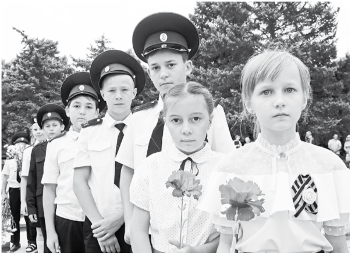
Жители села Солдато-Александровского присоединились к Всероссийской акции «Минута молчания» и возложили цветы к мемориальному комплексу «Огонь Вечной Славы»

В этот день 81 год назад жизнь почти 200 млн человек разделилась на «до» и «после» – по всем городам разнеслось тревожное сообщение о нападении вражеских войск на Советский Союз. Началась Великая Отечественная война – 1418 дней, полных героизма и мужества.