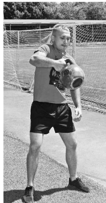
Силовики поднимали 24-килограммовую гирию