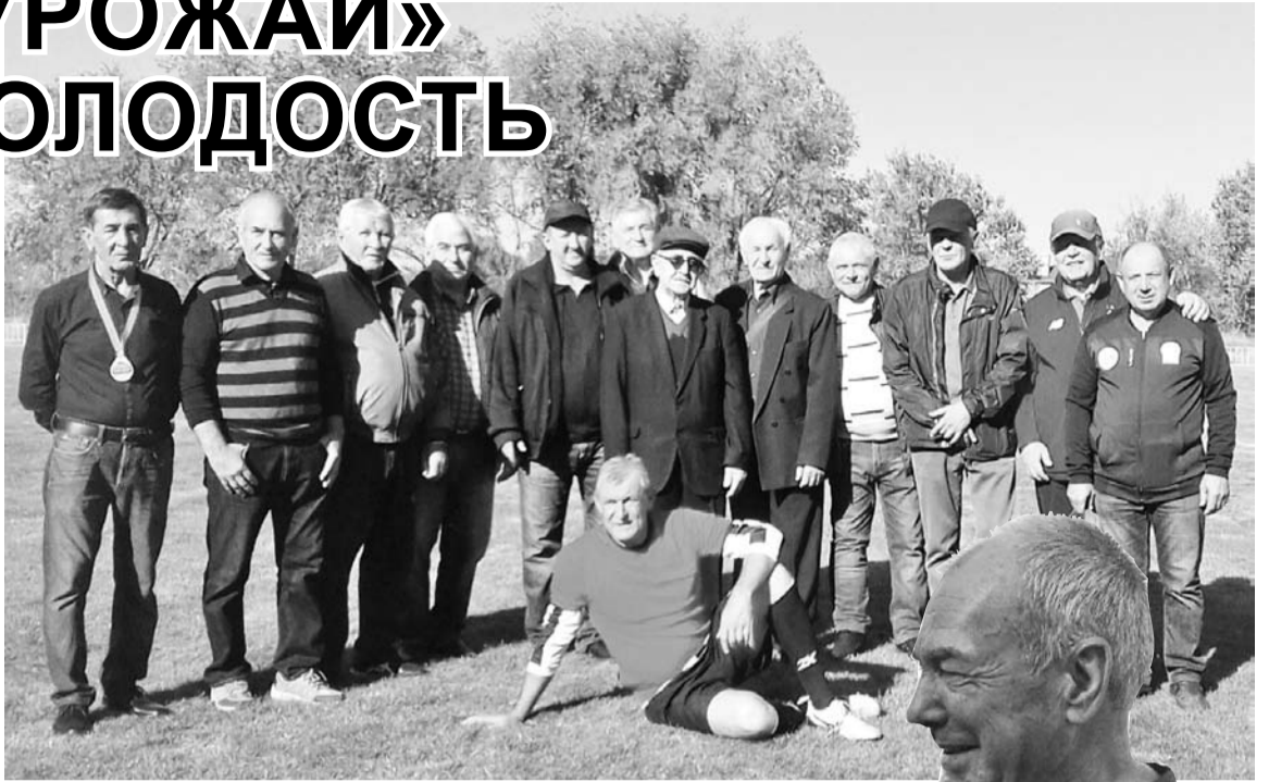
Легенды ФК «Автомобилист»