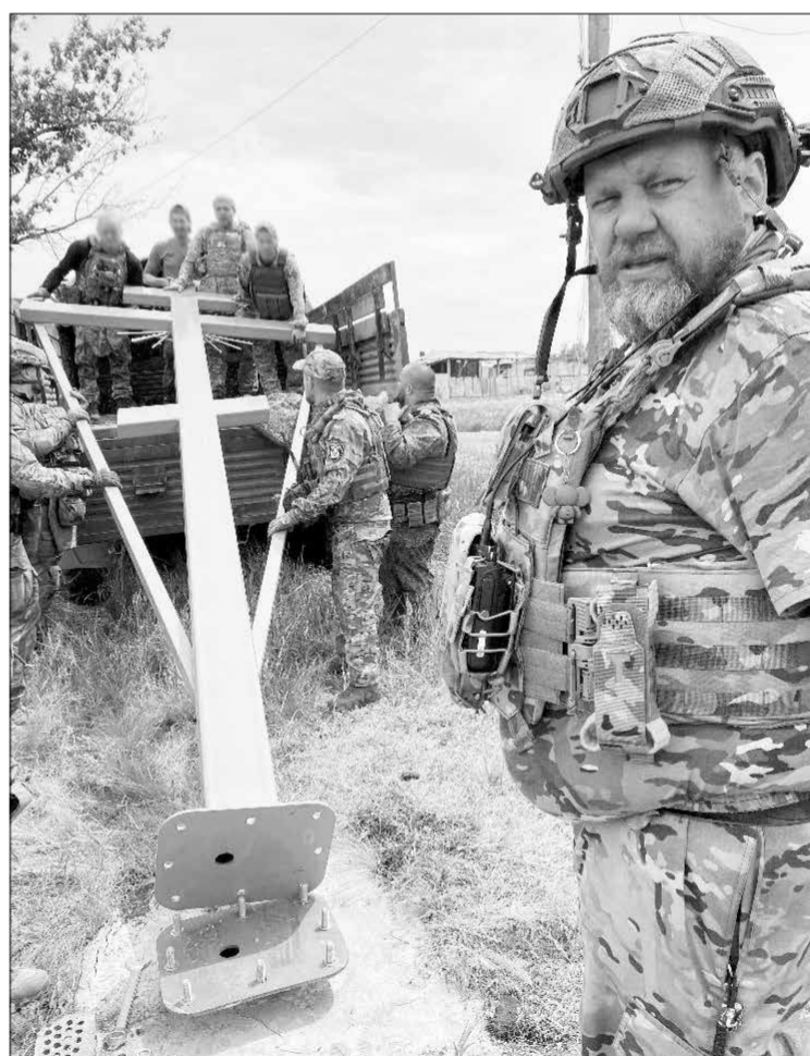
Установка поклонного креста у посёлка Кодема под Клещевкой (ДНР). Штурмовое подразделение «Балтика» (командир – Баркас) началось оттуда свой боевой путь в 2023 году, удерживая позиции три месяца. Перед этим там не могли закрепиться два батальона.

– Да-да, я Вам, – улыбнулся мужчина. Высокий, статный, широкие плечи. И добрые глаза.