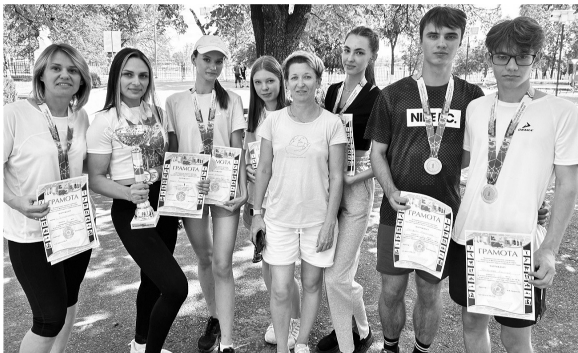
Команда-победитель города Зеленокумска