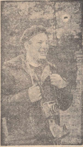
На снимке: Юрий Алексеевич Гагарин, 1965 год.