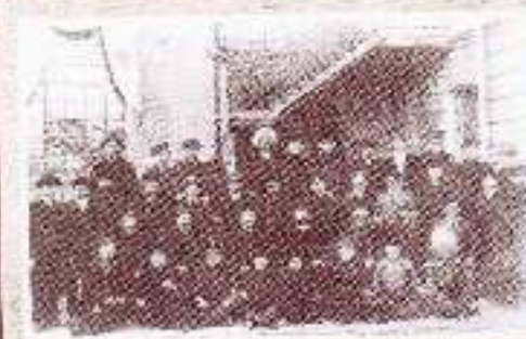
Незлобинский молкомбинат. Служащие мельницы. около 1910 г.