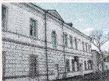
Северная сторона здания