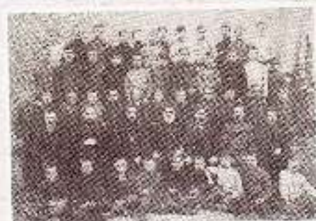
Первый выпуск Воронцово-Александровской ремесленной школы (около 1902 г.)