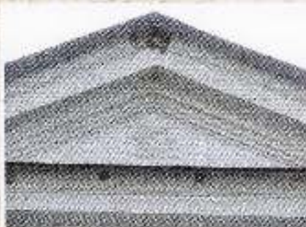
Ризалит с фронтоном северная сторона с датой постройки (1899 г.)