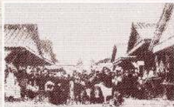
Торговая площадь с. Верный. Александровское.

Н роступившись и выйдя из постоянного двора, журналист из Санкт - Петербурга Семён Васюков сразу же окунулся в пёстрый громкоголосый мир ярмарочных лавок. Торголя развернулась прямо в центре села, на площади. Именно здесь кипела жизнь местных жителей, здесь были их главные интересы, здесь результаты труда выражались в конкретную величину выручки от произведённого товара.