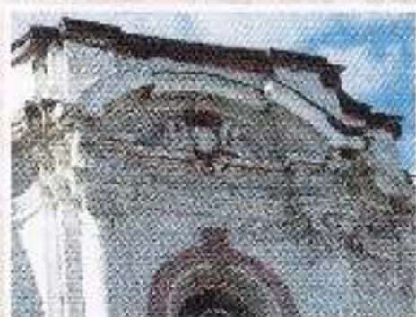
Фронтон над выходом на балкон (парадный вход)