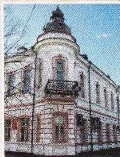
Угловой эркер с балконом

С севера дом Кащенко подобен огромному кораблю, выходящему из тенистого парка навстречу правобережной части города. Здесь по вертикали его членил только небольшой выступ и плоский ризалит с треугольным фронтоном, в котором выложена дата постройки - 1899 год. Эти членения соответствуют внутреннему делению здания на три зоны - парадную, жилую и хозяйственную. Ризалит отмечает и место чёрного входа, расположенного со стороны дворового фасада. Хозяйственная часть сохранилась кирпичной. Остальные фасады оштукатурены.