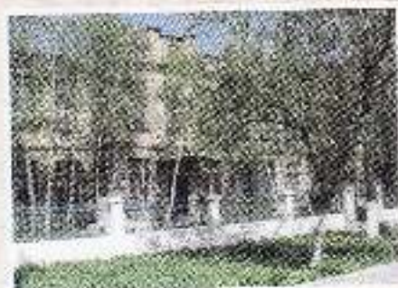
Воронцово-Александровская прогимназия (школа № 1).