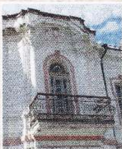
Балкон над парадной дверью