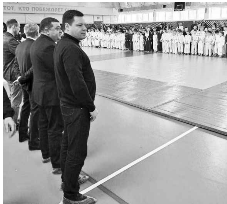
В турнире участвовали более 300 спортсменов.

Спорт. В ФОК «Виктория» состоялись соревнования по дзюдо