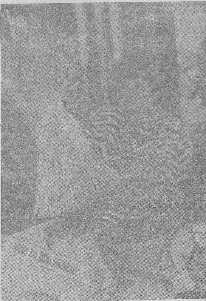
той осени, «Времена года», день птиц и другие.

У нас есть и специальные группы для учеников 9-10 классов, где они углубленно изучают биологию. Гордость станции — небольшой живой уголок. Здесь живут морские свинки, попугаи, хомячки, амадины, канарейки. Большое внимание мы уделяем организации различных мероприятий, в которых используем все возможности станции — праздник золо-