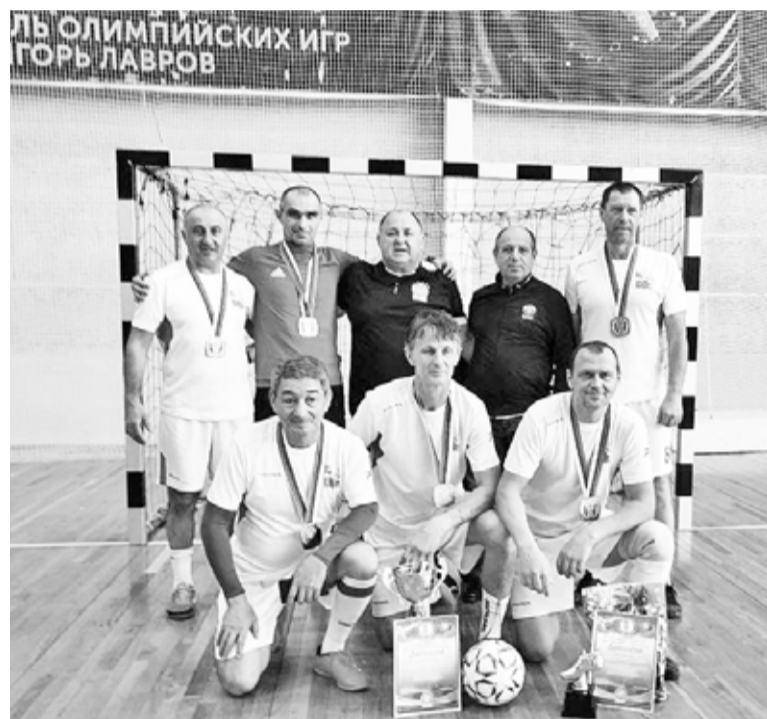
Районная футбольная команда ветеранов