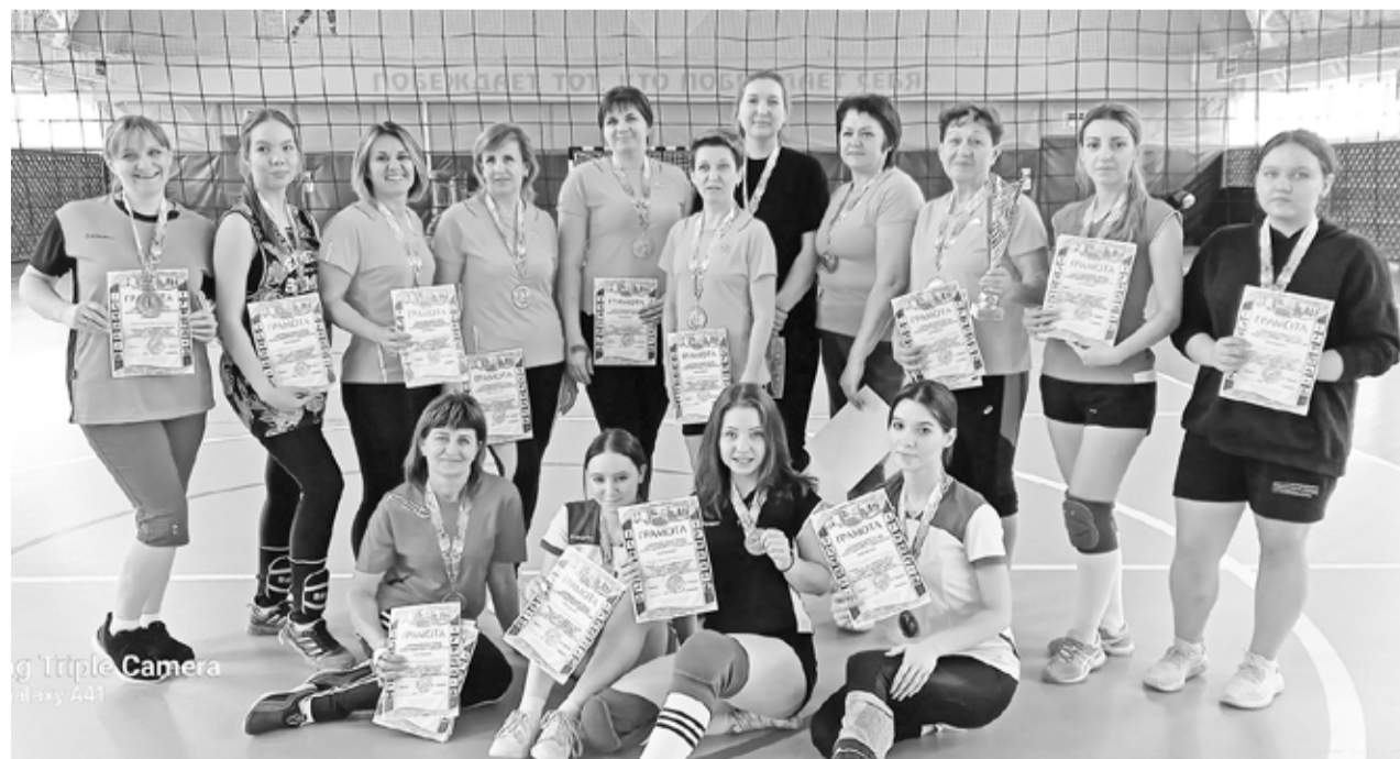
Женские волейбольные команды района