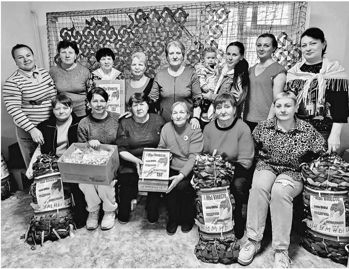
Нинская группа «МыВместе».