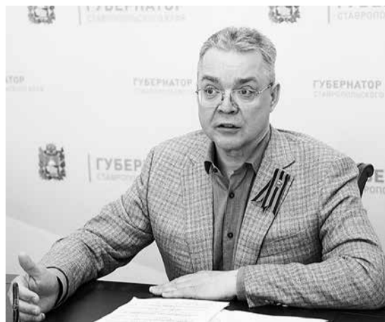
Владимир Владимирович в ходе совещания.

Глава региона Владимир Владимирович подчеркнул необходимость повышенного внимания к вопросу и дал поручение усилить мониторинг гидрологической обстановки.