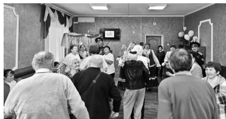
А много ли для счастья надо?

поэтессы Ларисы Рубальской: Есть пословица: Старость - не в радость. Сомневаюся, верна ли она. Даже если и малость осталась, Я по-прежнему в жизнь влюблена. Это всё объясняется просто, Ведь судьба наша - в наших сердцах: