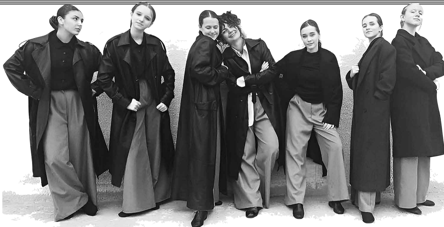
Участники спектакля «Есенин. Родина. Любовь».