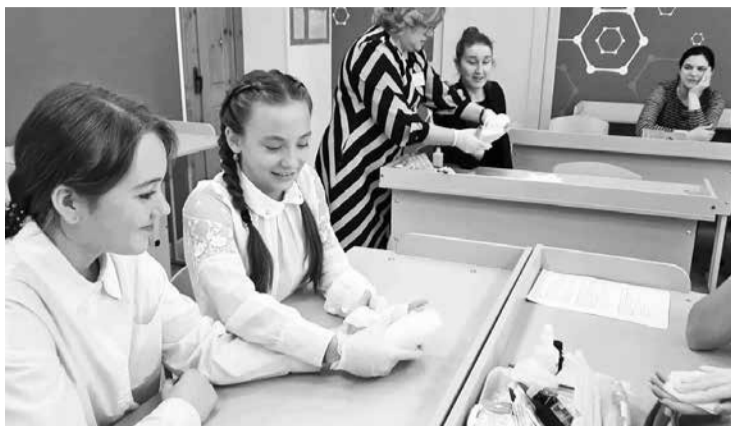
Внеурочное занятие по теме «Первая помощь при кровотечениях» оказалось не только интересным, но и полезным.

Около 30 учителей округа собрались в образовательном центре «Точка роста» СОШ №11, чтобы познакомиться с лучшими методиками коллег принимающей стороны.