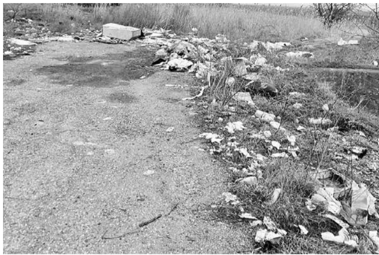
В марте работники МУП «ЖКХ г.Зеленокумска» ликвидировали стихийную свалку вдоль федеральной трассы (юго-западнее х.Средний лес). Ежегодно на ликвидацию ей подобных из бюджета округа расходуются денежные средства, которые можно было бы направить на благоустройство, улучшение инфраструктуры населённых пунктов. И никакие штрафы не способны покрыть эти траты.

Исполнено постановление о наложении административных штрафов на 98700 рублей. С тех, кто не торопился сделать это добровольно и в установленные сроки, служба судеб-