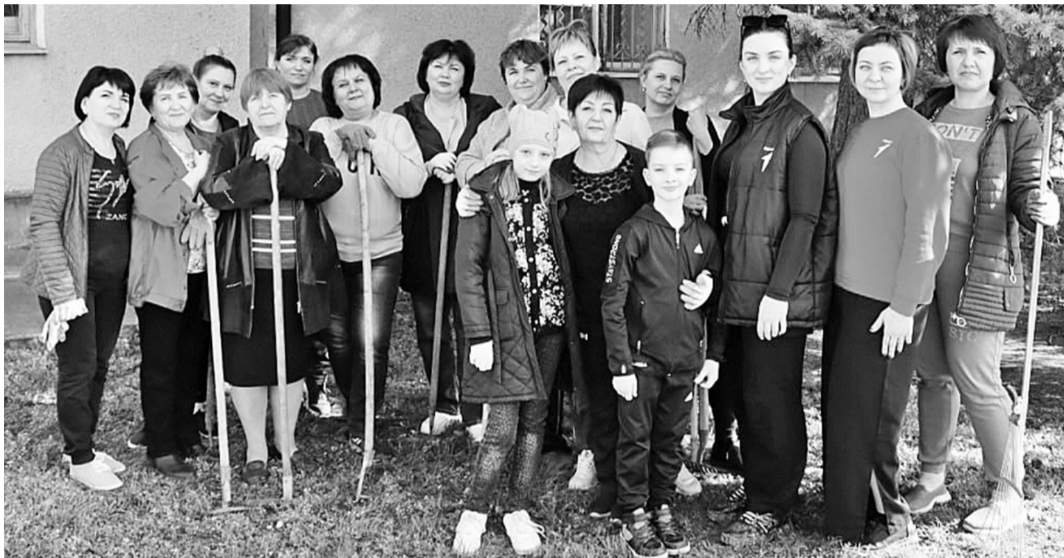
Коллектив управления образования в полном составе вышел на субботник. В помощники вызвались и их дети.

Информация управления сельского хозяйства