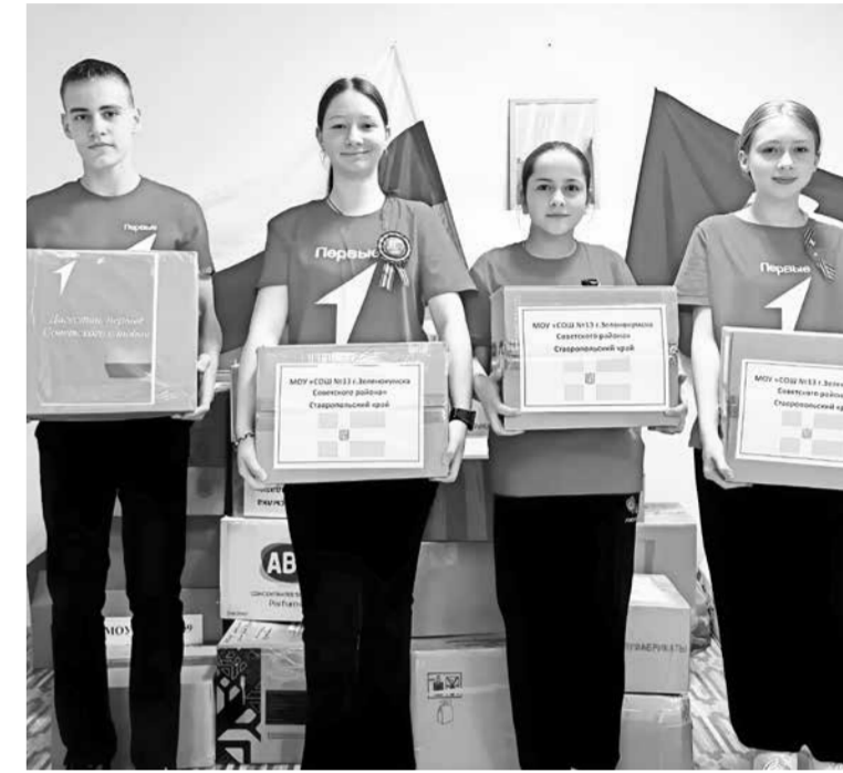
«Первые» городской школы №13 также приняли участие в сборе гуманитарной помощи Дагестану.

До сих пор не прекращается поток комментариев под постами о нём: люди разных национальностей благодарят 41-летнего мужчину и восхищаются его самоотверженным поступком, отмечая, что, несмотря на