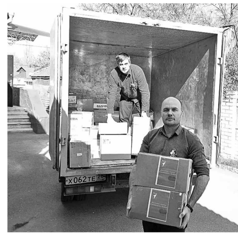
Гумконвой от Советского округа отправило местное отделение партии «Единая Россия».

его скромный рост, в груди бьётся большое сердце.