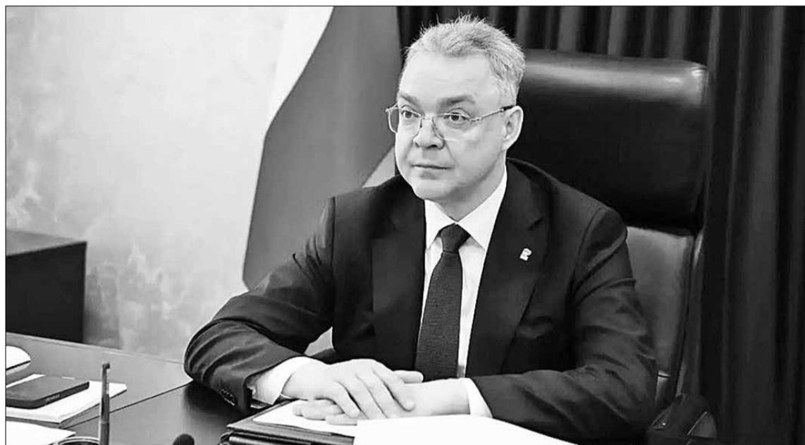
Владимир Владимиров в ходе заседания.

– Главная задача – обеспечить надёжное и беспере-