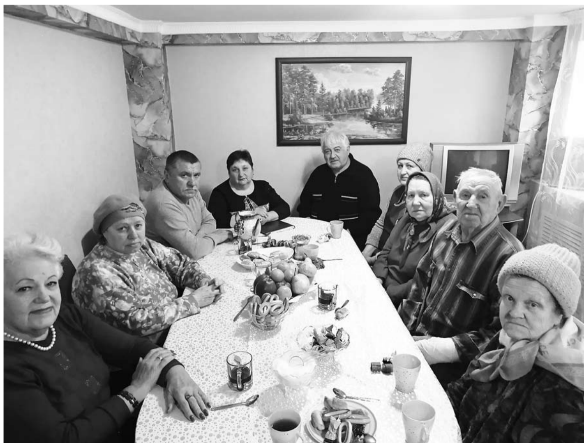
На очередную встречу собрались дружные соседи хутора Колесникова

Подготовила Н.МАСЛЕННИКОВА