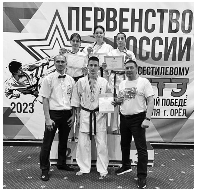
Все представители округа в составе сборной края вернулись с первенства России с медалями

А далее был дан старт непосредственно соревновательной части. Молодые и совсем юные