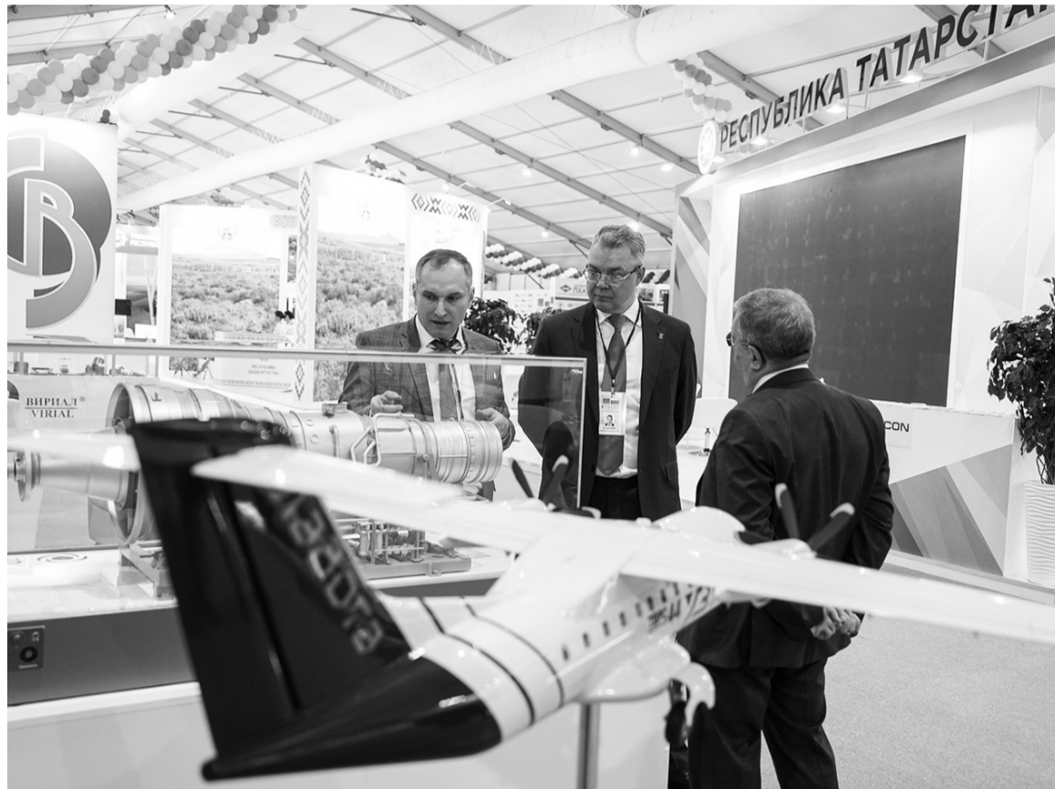
Республика Беларусь является одним из опорных торгово-экономических партнёров Ставрополя