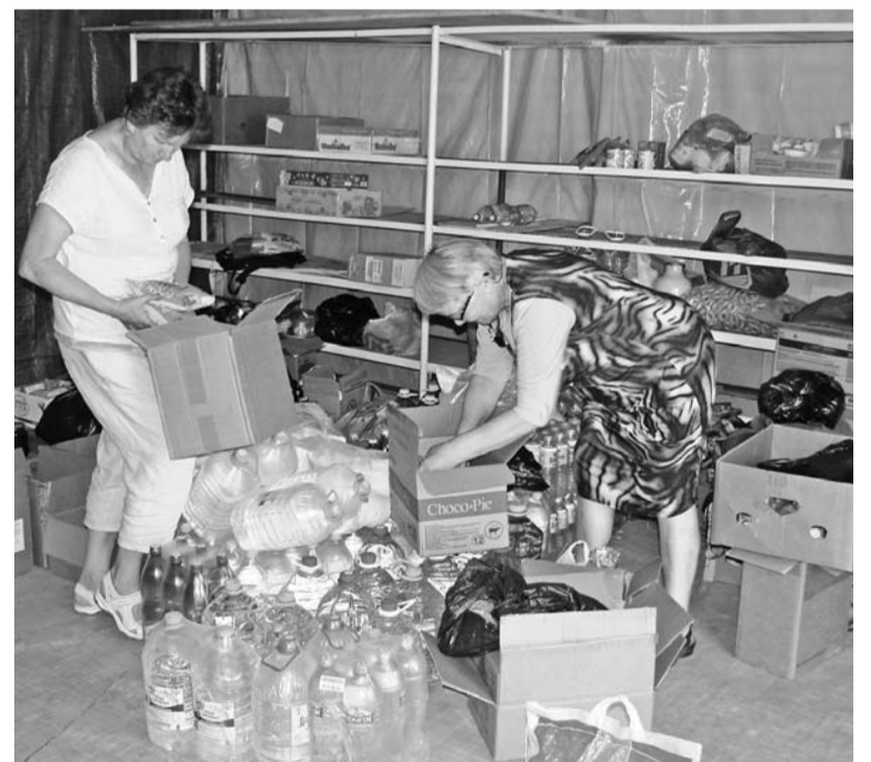
Параллельно собирают гумпомощь

ются к маскировкам, говорят, американские сети более редкие, чем сделанные их руками.