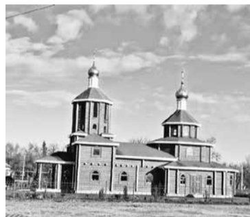
Фундамент храма великомуче- ника Георгия Победоносца в ху- торе Восточном был заложен в 2010 году. Строительство дли- лось 11 лет, первая литургия про- шла в апреле 2021 года.