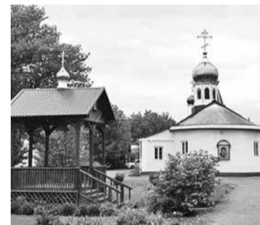
Церковь Казанской иконы Бо- жией Матери - самая старая в округе. В 1943 году верующие от- крыли в бывшем жилом здании молитвенный дом, он был пере- строен в храм, который на дол- гие годы стал духовным центром и визитной карточкой православ- ного Зеленокумска.