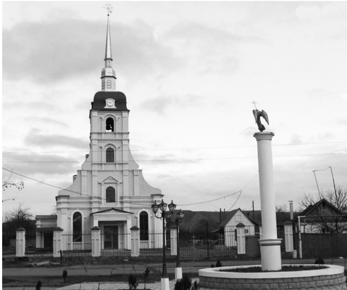
Храм святых апостолов Петра и Павла в Зеленокумске освящён в 2010 году. В 1998-м было начато его строительство. В 2004-м установили шпиль с ангелом. Храм возводился в течение 13 лет на деньги горожан и благотворителей. Высота колокольни - 40 метров. Данный храм является уменьшенной копией Петропавловского собора в г.Санкт-Петербурге.