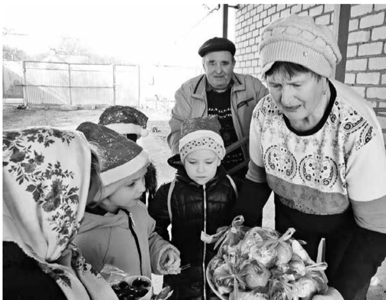
Рябятишки-участники клубных формирований культурно-досугового центра и библиотеки с.Правокумского умеют посеять и колядовать с соблюдением народных традиций

Подготовлено по материалам электронных СМИ