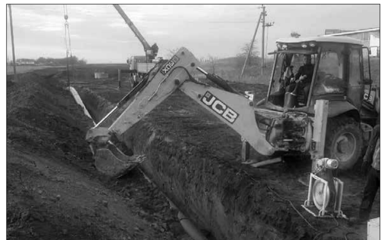
По итогам 2023-2024 годов качество водоснабжения улучшится для 300 тысяч жителей Ставрополья.

системы теплоснабжения. В частности, в Невинномыске завершат строительство блочно-модульной котельной мощностью 20,5 МВт. Капитально отремонтируют два крупных участка городских тепломаршрутов. Направят средства на строительство блочно-модульных котельных в Пятигорске и Нефтекумске. Всего в 2023-2024 годах с привлечением средств фонда в сфере водоснабжения будут реализованы 19 значимых проектов общей стоимостью 3,8 миллиарда рублей, причём 1,1 миллиарда выделяются из краевого бюджета. По итогам двух лет качество водоснабжения улучшится для 300 тысяч жителей Ставрополья.