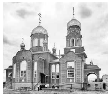
Храм святого благоверного кня- зя Александра Невского в селе Солдато-Александровском стро- ился с 2000 года, в сентябре про- шлого состоялось первое бого- служение.