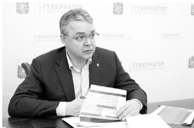
Владимир Владимиров поручил при выполнении догазификации уделить особое внимание нуждающимся в соцподдержке.

На Ставрополье продолжает действовать социальная догазификация в населённых пунктах, где уже проложены газопроводы. С помощью этого социального проекта жители могут бесплатно подвести газ к границе своего домовладения.