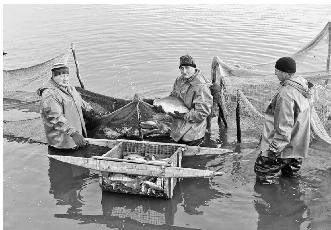
Рыбаки рыболовецкой бригады во время отлова