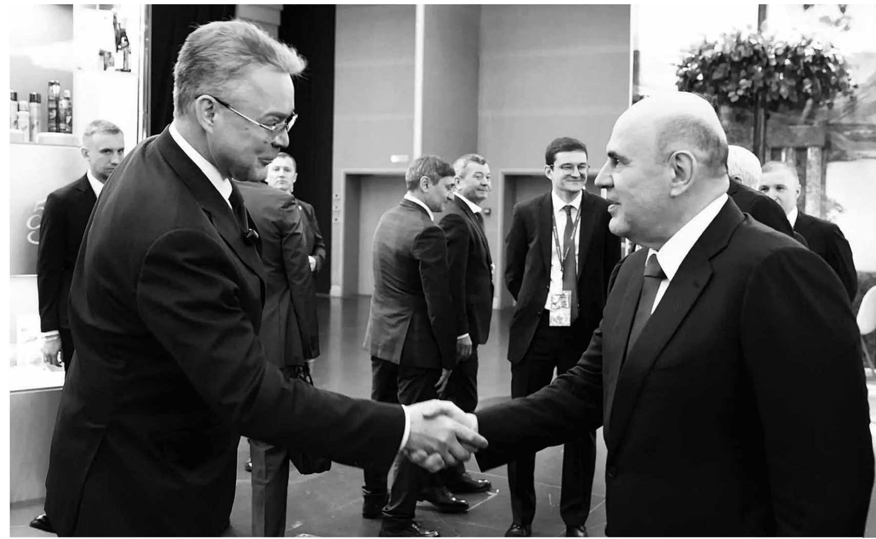
Владимир Владимиров и Михаил Мишустин в ходе Кавказского инвестиционного форума.

треть в будущее, нам необходимы инвестиции и такие форумы, как КИФ. Желая всем участникам продуктивной работы, а молодым предпринимателям – только побед! – отметил губернатор.