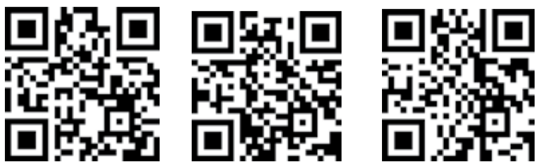
Фото и видео смотрите здесь:

Никому не было скучно на ярмарке. Картины из круп и пластилина, изделия из джута, выставка работ Зеленокумской детской художественной школы и ретро-автотранспорта от легендарной команды по мотоболу «Молния», вернее, от её преемников - «Стрел Молнии», предметы творчества читателей библиотек всего района... Чего здесь только не было! Мероприятие проходило под песни преподавателей городской детской музыкальной школы, ансамбля «Хуторяночка», самодеятельных артистов домов культуры поселений. В планах администрации проводить такие ярмарки-праздники регулярно. И наверняка со временем в ней будут принимать участие больше товаропроизводителей и жителей округа.