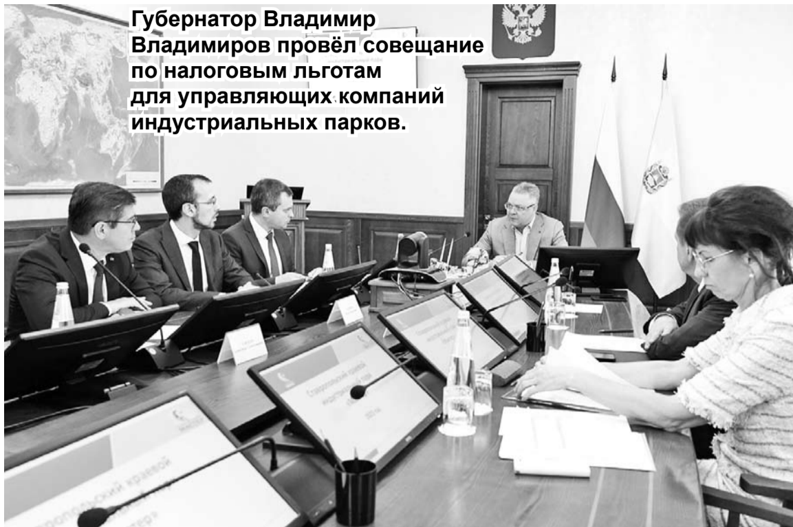
Губернатор Владимир Владимиров провёл совещание по налоговым льготам для управляющих компаний промышленных парков.

В.Владимиров поставил перед министерством энергетики, промышленности и связи задачу подбора дополнительных площадок для создания новых мощностей промышленного парка