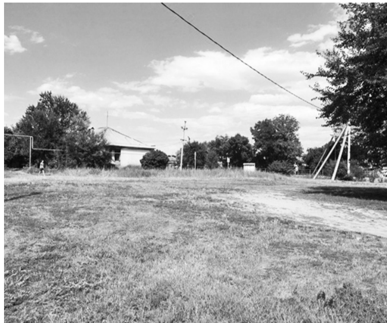
В районе православного детского сада в городе обустраивают сквер со спортивной и детской игровыми площадками