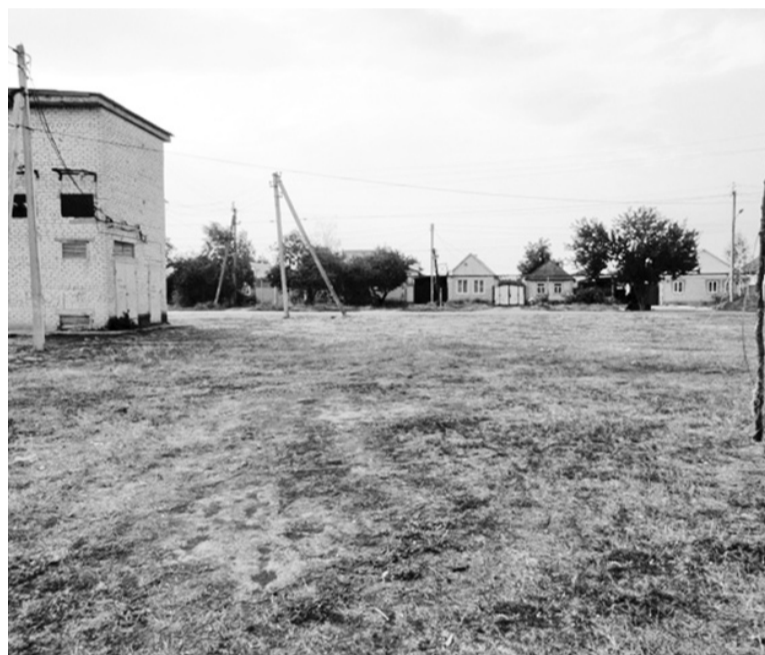
На пересечении улицы Георгиевской и одноимённого с ним переулка в Зеленокумске появится новая спортивная площадка