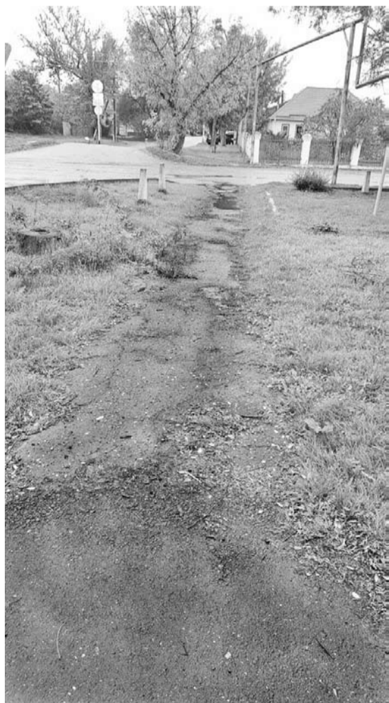
Этот тротуар на площади Победы с.Отказного скоро будет выглядеть совсем по-другому