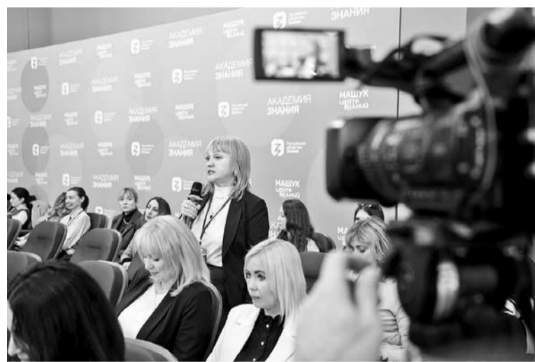
В центре знаний «Машук» состоялась новая образовательная программа для журналистов «ТАСС. Десант»

— Мы не случайно назвали это мероприятие «ТАСС. Десант». В таком формате и таким представительным составом мы собираемся впервые. Сюда приехали руководители самых разных направлений работы агентства.