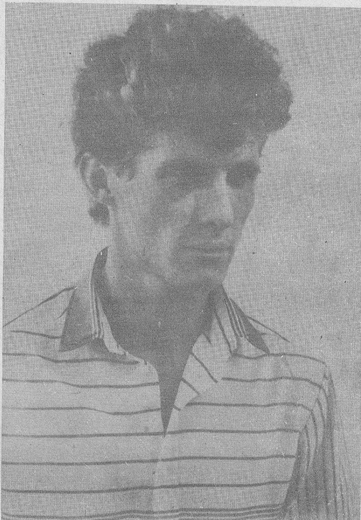
На уровне поставлена работа в коллективах по откорму крупного рогатого скота породы «Лимузин» и «Шароле» совхоза «Кумской». Между звеньями идет трудовое соперничество, что позволяет добывать хороших результатов.

До перерыва в работе сессии было объявлено, что на флагштоке здания Дома Советов России будет поднят трехцветный — красно-сине-белый национальный