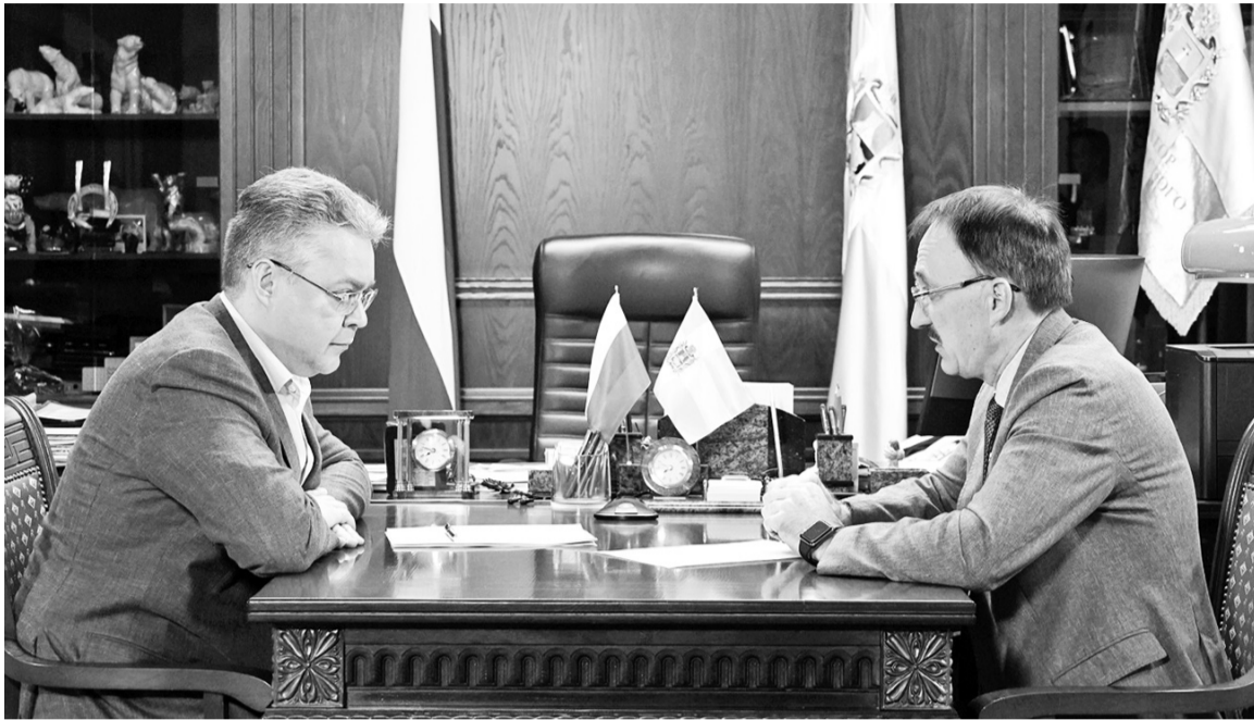
На Ставрополье дополнительно появятся 54 центра цифрового и гуманитарного профилей «Точка роста»