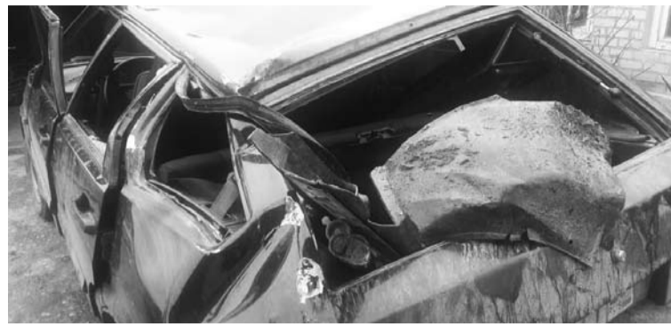
Автомобиль с явными повреждениями находился во дворе домовладения

С переломом грудной клетки, ушибами и ссадинами тела в больницу доставлена 17-летняя пассажирка, жительница села. Тяжесть травм обусловлена тем, что девушка не пристегнулась ремнём безопасности. Сотрудники ОГИБДД провели мероприятия по поиску водителя. Он разыскан, автомобиль с явными повреждениями находился во дворе домовладения. Установлено, что 21-летний местный житель был трезв, но водительского удостоверения не имеет. По факту автоаварии проводится проверка.