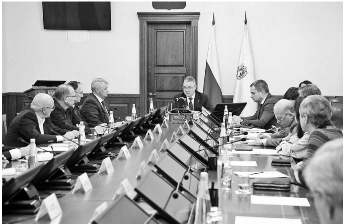
На совещании обсуждены вопросы использования и расширения мер поддержки действующих промышленных в крае производстве