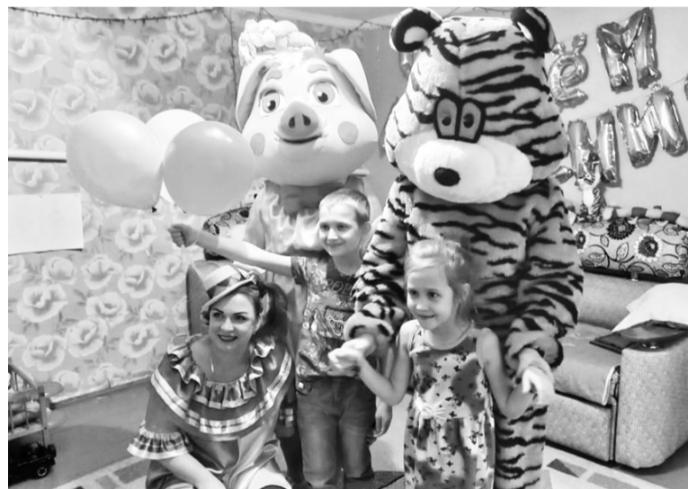
Дети с радостью принимали ярко оформленные подарки

Искренняя радость уставших от самоизоляции детей была настолько трогательна и волнительна, что никого не оставила равнодушным.