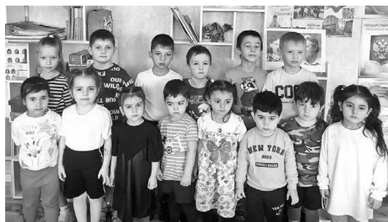
Дети разных национальностей дружат.

Проводятся выставки поделок, конкурсы рисунков, тематические утренники. Очень нравятся малышам виртуальные путешествия по стране.