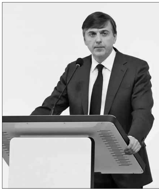
Сергей Кравцов в ходе встречи.

- Образование сегодня - важнейший фактор кон-