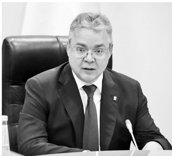
В.Владимиров: «Поправки в краевой бюджет обеспечат выполнение соцобязательств и развитие инфраструктуры на Ставрополье»

Более 580 миллионов рублей будет направлено на реализацию программ благоустройства, а именно, развитие курортной инфраструктуры,