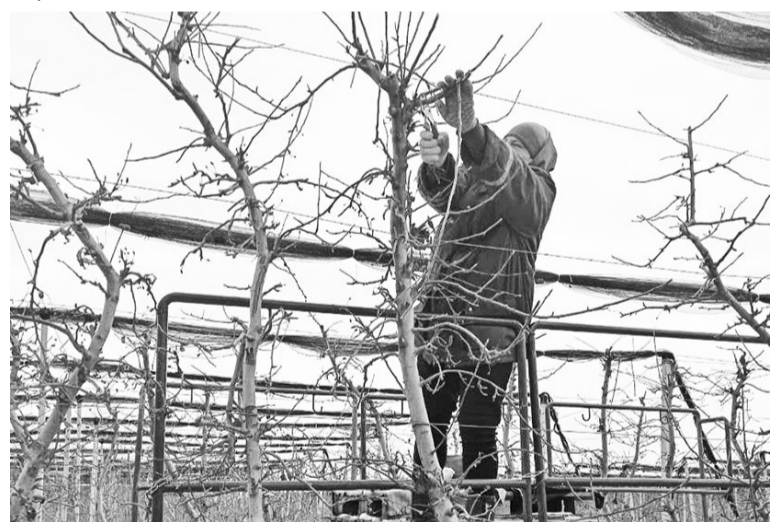
Аграрии Ставрополья занимаются обрезкой садов, работы запланированы на площади более 4,5 тысячи га

В крае выращивают различные сорта яблок, груш, слив, вишни, черешни, алычи.