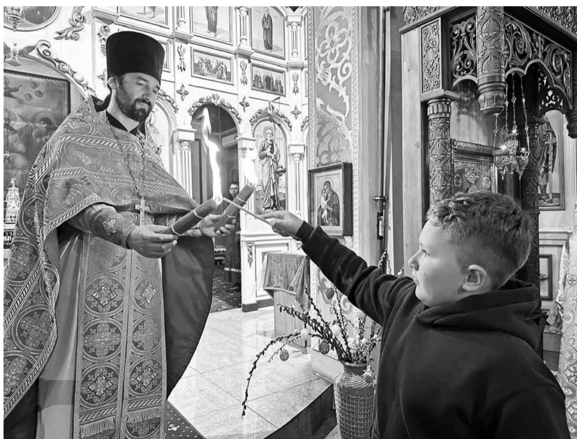
Юные прихожане, затаив дыхание, зажигли свои свечи от Благодатного огня.