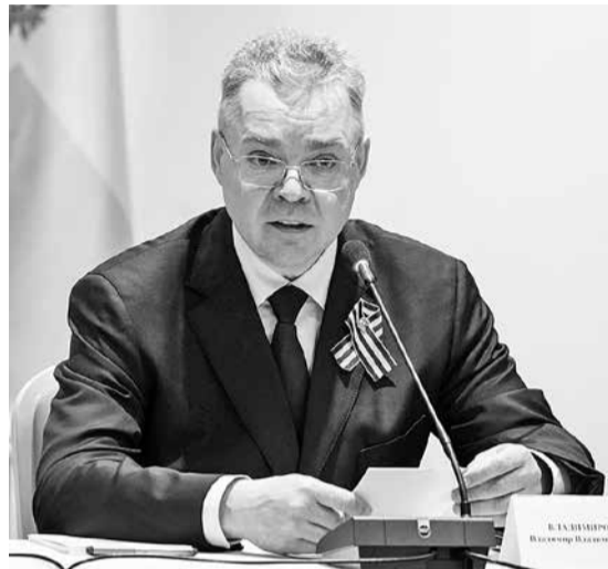
ВЛАДИМИР ВЛАДИМИРОВ В ХОДЕ ЗАСЕДАНИЯ.

– Всё это накладывает на нас особые обязательства. Как всегда, должны быть приняты исключительные меры безопасно-