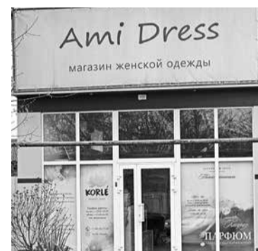
Согласитесь: не всем понятны такие надписи.

Это позволит придать улицам округа единый и современный архитектурный облик. Согласование дизайн-макетов осуществляет управление градостроительства и муниципальной администрации округа. Использование англицизмов в оформлении вывесок не допускается.