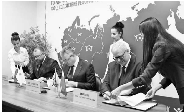
В Москве состоялось подписание ряда соглашений о сотрудничестве между правительством Ставрополья и Фондом развития территорий

Благодаря привлечённым средствам из Фонда развития территорий, объём которых составляет порядка 2,7 млн рублей, в 2023-2024 годах на Ставрополье будут проведены работы на 19 объектах водоснабжения. Также на реализацию этих проектов из регионального бюджета будет привлечено более 675 млн рублей.