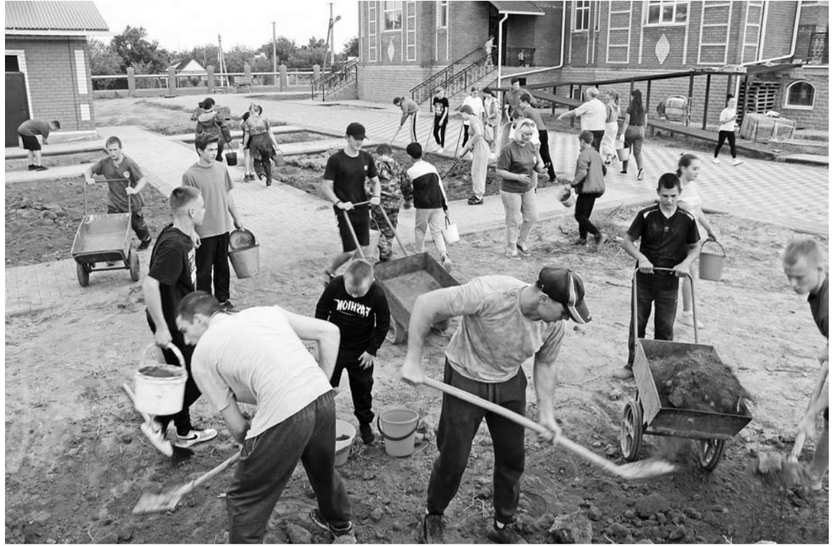
Усердие юных прихожан на прошедшем субботнике устанавливает остальным взрослым ориентир

Во дворе нового храма, строящегося уже, наверное, третье десятилетие на улице Шоссейной с.Солдато-Александровского, работа кипела. Мальчики и девочки из школ села с важностью водителей-дальнейщиков сновали взад-вперёд по уложенной недавно тротуарной плитке с вёдрами, тачками с землёй, привезённой из отвалов, которые образовались давно ещё - при вскрытии песчаных карьеров между селом и посёлком Михайловка.