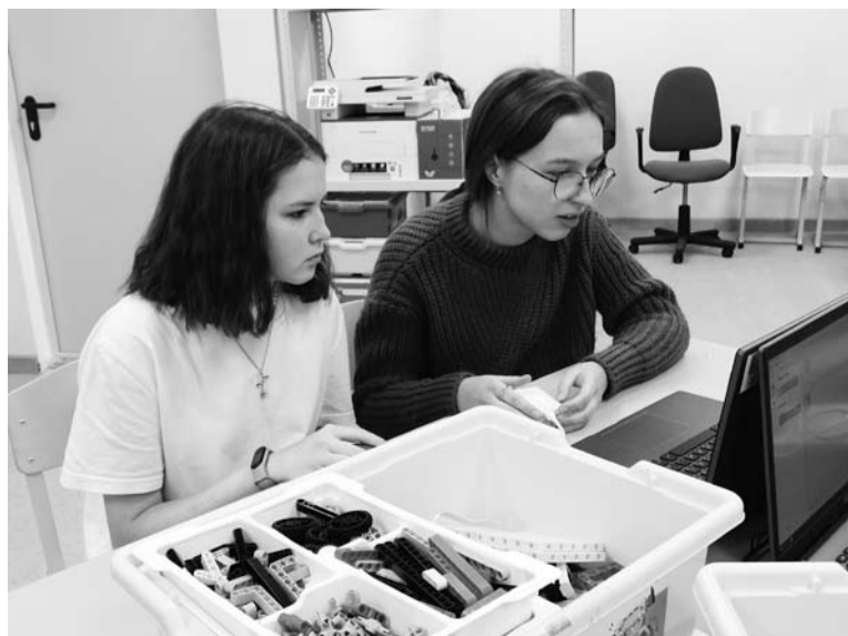
Конструктор «Лего» - не только для игр