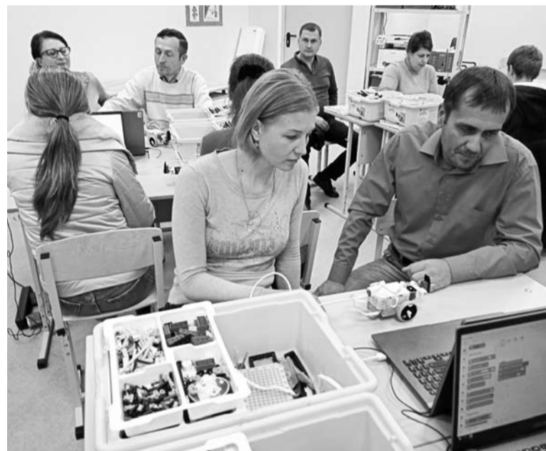
Родители были потрясены увиденным

и дополненная реальность/ Информационные технологии» позволит школьникам изучить различные операционные системы, программное обеспечение для выявления их уязвимости на предмет незаконного проникновения, а также научиться в виртуальном пространстве моделировать объекты и разнообразные ситуации, приближенные к реальности. Эти знания и навыки понадобятся тем, кто решит стать специалистом по кибербезопасности или гейм-дизайнером – разработчиком компьютерных игр.