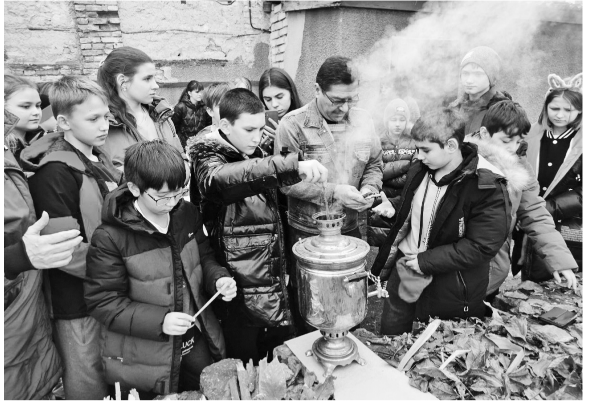
Ребята пробуют растопить самовар самостоятельно

Сейчас можно выделить три главных события, ставших наиболее популярными и у владельцев «Пушкинских карт», и у ребят, не достигших 14 лет. В первую очередь, это музейное чаепитие «Тайны русского самовара», главная цель которого не «откушать чай». Ребята пьют его в конце занятия, получив знания о самоваре и попробовав растопить его самостоятельно. Это именно занятие, а не повод отдохнуть за чайным столом. Возможность прикоснуться к старинному самовару, изучить его устройство, посмотреть, как работает жаровня, послушать, как поёт и шумит вода - всё это делает занятие по-настоящему праздничным и интересным. Поэтому чай в конце встречи особенно вкусен и ароматен, а дымок, которым веет от самовара, создаёт осо-