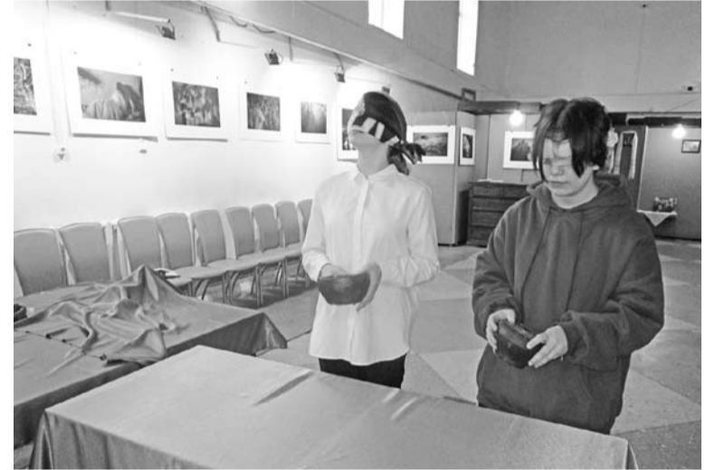
Квест-эксперимент «Фотографируй. Трогай. Говори!»

Другие мероприятия, пользующиеся спросом, - интеллектуальный квиз (викторина) «Зеленокумск: мифы и реальность» и квест-эксперимент «Фотографируй. Трогай. Говори!» Если с викториной всё понятно, то эксперимент - абсолютно новая форма. Он частично нарушает музейные табу на использование телефонов, необходимость соблюдать тишину и ничего не трогать руками. Вначале ребята получают задания с вопросами. Им нужно понять, о чём идёт речь, отгадать, что за экспонат зашифрован, найти его и сфотографировать. Если на фото нето, все вместе ищут правильный ответ. Второй этап эксперимента - определить предмет на ощупь с завязанными глазами. Исследовать мы предлагаем самые простые вещи, но, не видя их, подросткам порой очень трудно понять, что это такое. Эксп-