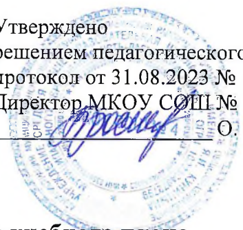
Таблица-сетка часов учебного плана начального общего образования муниципального казенного общеобразовательного учреждения средней общеобразовательной школы № 4 им. Я. И. Куницына муниципального образования Усть –Лабинский район Краснодарского края для 4 класса на 2023 - 2024 учебный год