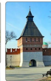
Башня Ивановских ворот.