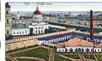
Здание первой городской электростанции. 1900 г.