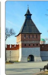
Башня Ивановских ворот.