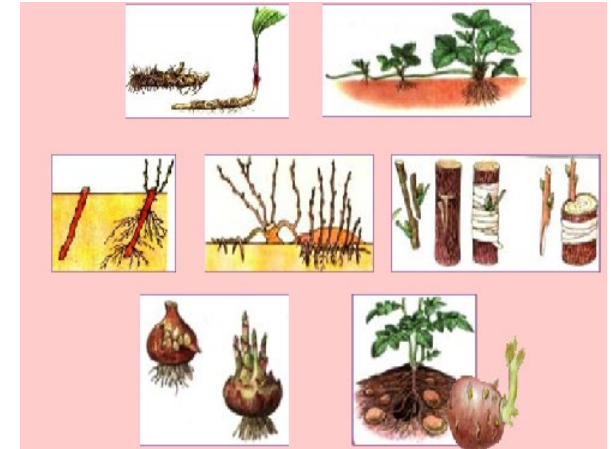
Размножение вегетативными органами