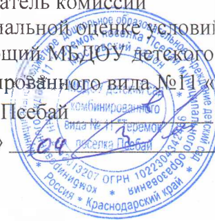
График проведения работ по специальной оценке условий труда.