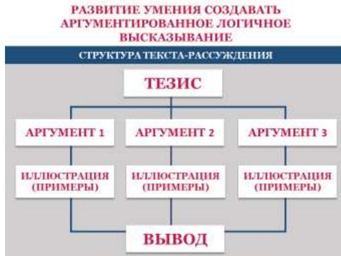
Рис. 1. Логическая структура сочинения-рассуждения (ФИПИ)

Также для создания плана итогового сочинения целесообразно использовать стратегию «Фишбоун» (диаграмму Исикавы).