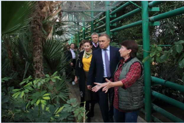
Ботанический сад Южного федерального университета