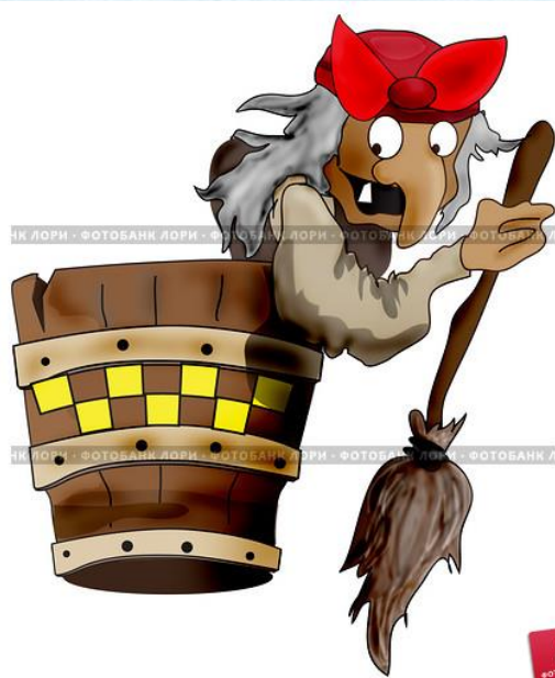
Баба Яга с меглой в ступе-такси