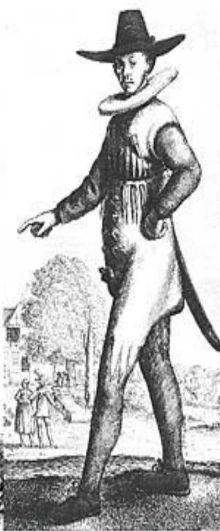
"Мосье а ля мод", XVII век