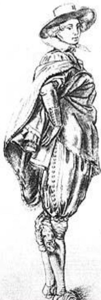
Денди, XIX век