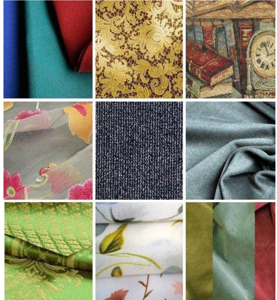
Виды тканей - фото: ткани габардин, гипюр (кружево), гобелен, деворе, джерси, драп, жаккардовая ткань, жоржет, замша.