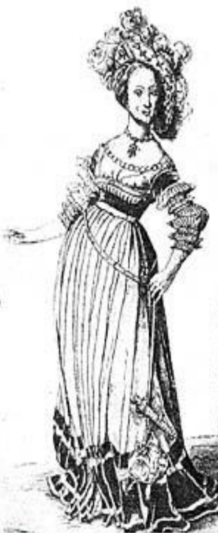
Девушка, XVII век