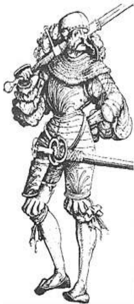
Солдат, XVI век