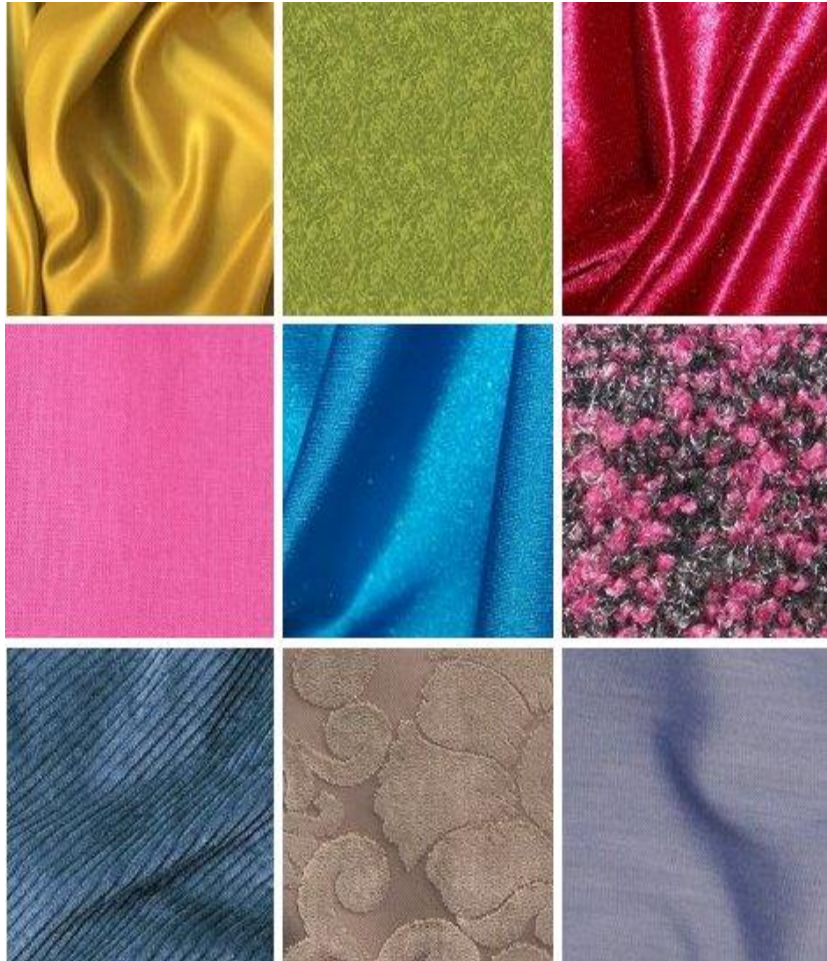
Виды тканей - фото: ткань атлас, альпака, бархат, батист, бифлекс, букле, вельвет, велюр и вискоза.