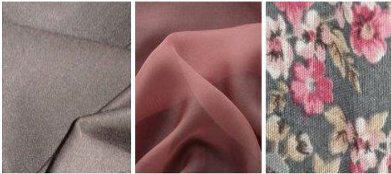
Виды тканей - фото: ткани кашемир, крэш, лайкра, лаке, лен, органза, парча (брокат), пике, плюш.