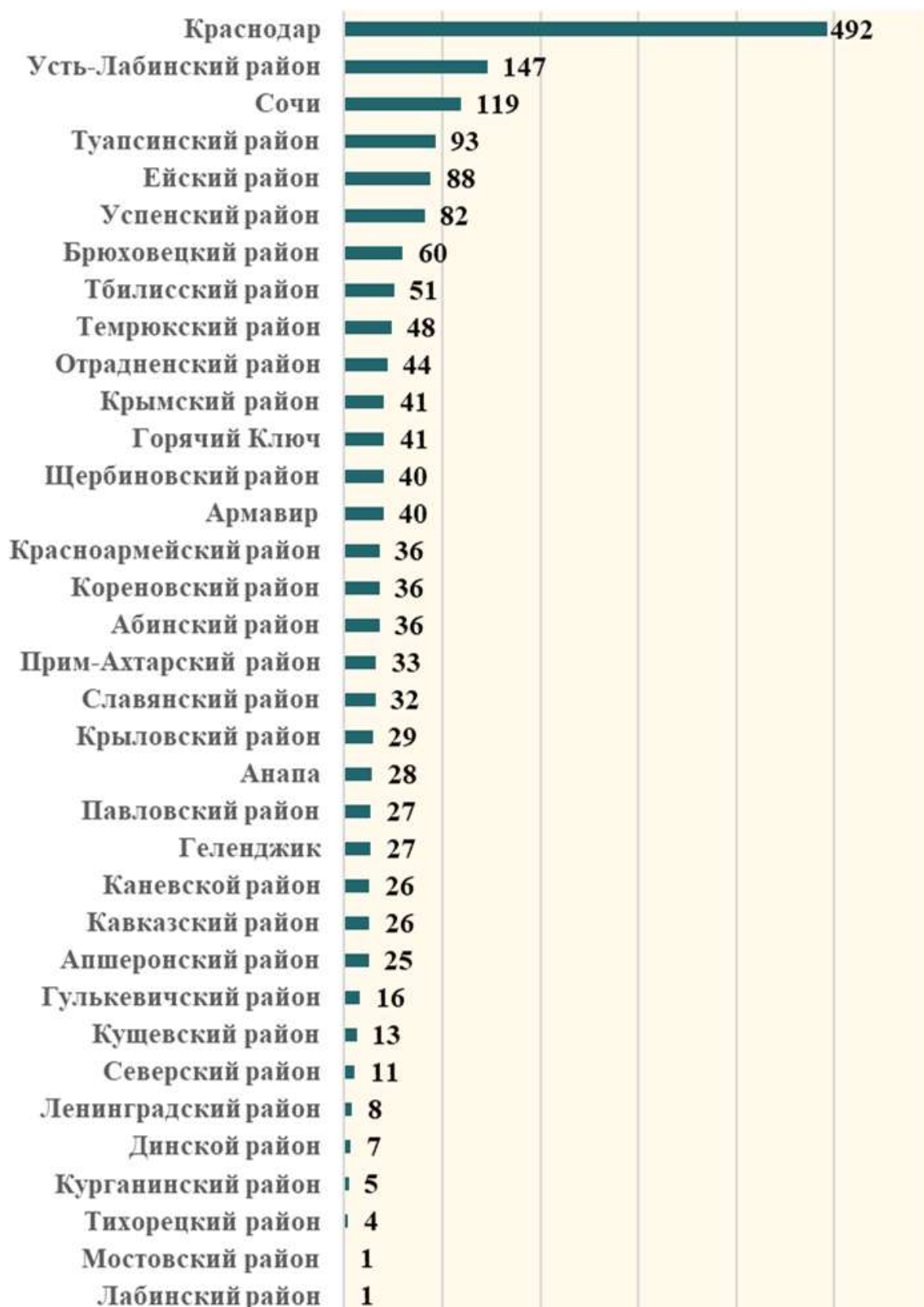
Рисунок 1. Количество слушателей из ШНОР в разрезе МО.

С 1 января 2023 года по 30 июня 2023 года, освоили различные дополнительные профессиональные программы, реализуемые Институтом, 1813 педагогических работников и управленческих кадров из 221 ШНОР (95% ШНОР).