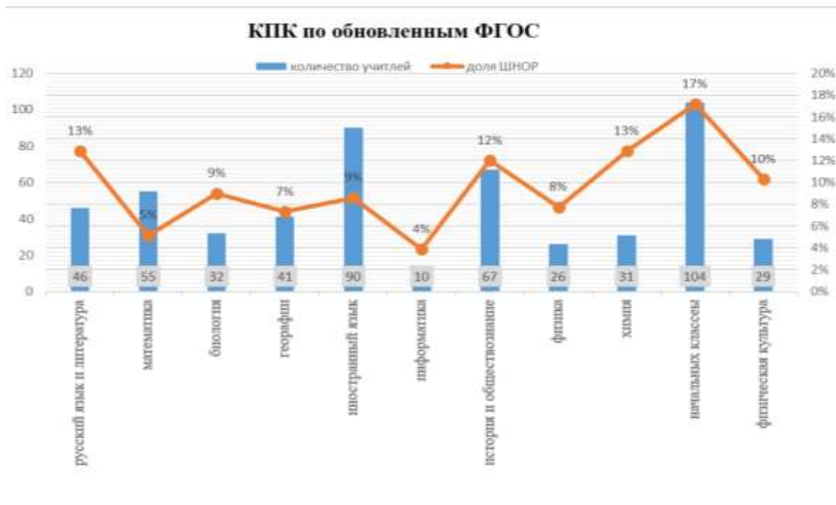
Рисунок 2. Статистика слушателей ДПП ПК по обновленным ФГОС из ШНОР в I полугодии 2023 года.

При проведении Мониторинга в части обучения педагогов ШНОР по ДПП ПК Института выявлено, что повышению квалификации по ДПП ПК по обновленным ФГОС прошли педагоги из 70 % ШНОР, по ДПП ПК ФГОС ЦОС (ЦОР) – педагоги из 57% ШНОР.