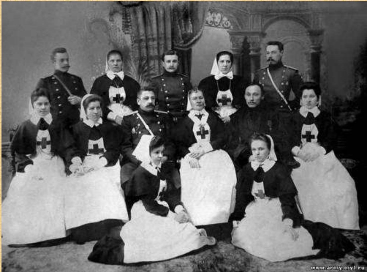
Попечители, члены Комитета и сестры милосердия Крестовоздвиженской общины перед отправкой на Дальний Восток. Санкт-Петербург. 1904