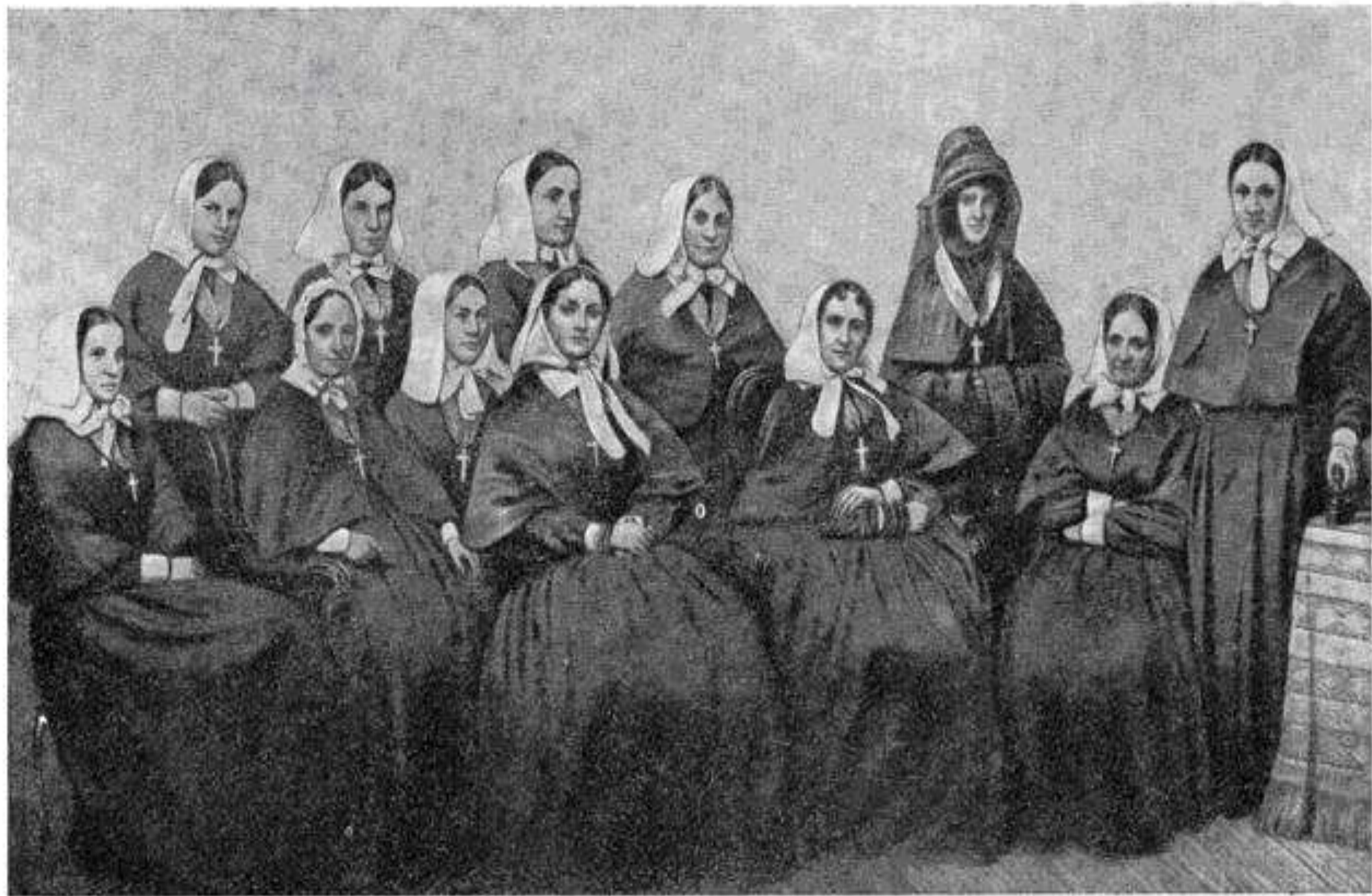
Группа сестер милосердия Крестовоздвиженской общины, участвовавших в обороне Севастополя.