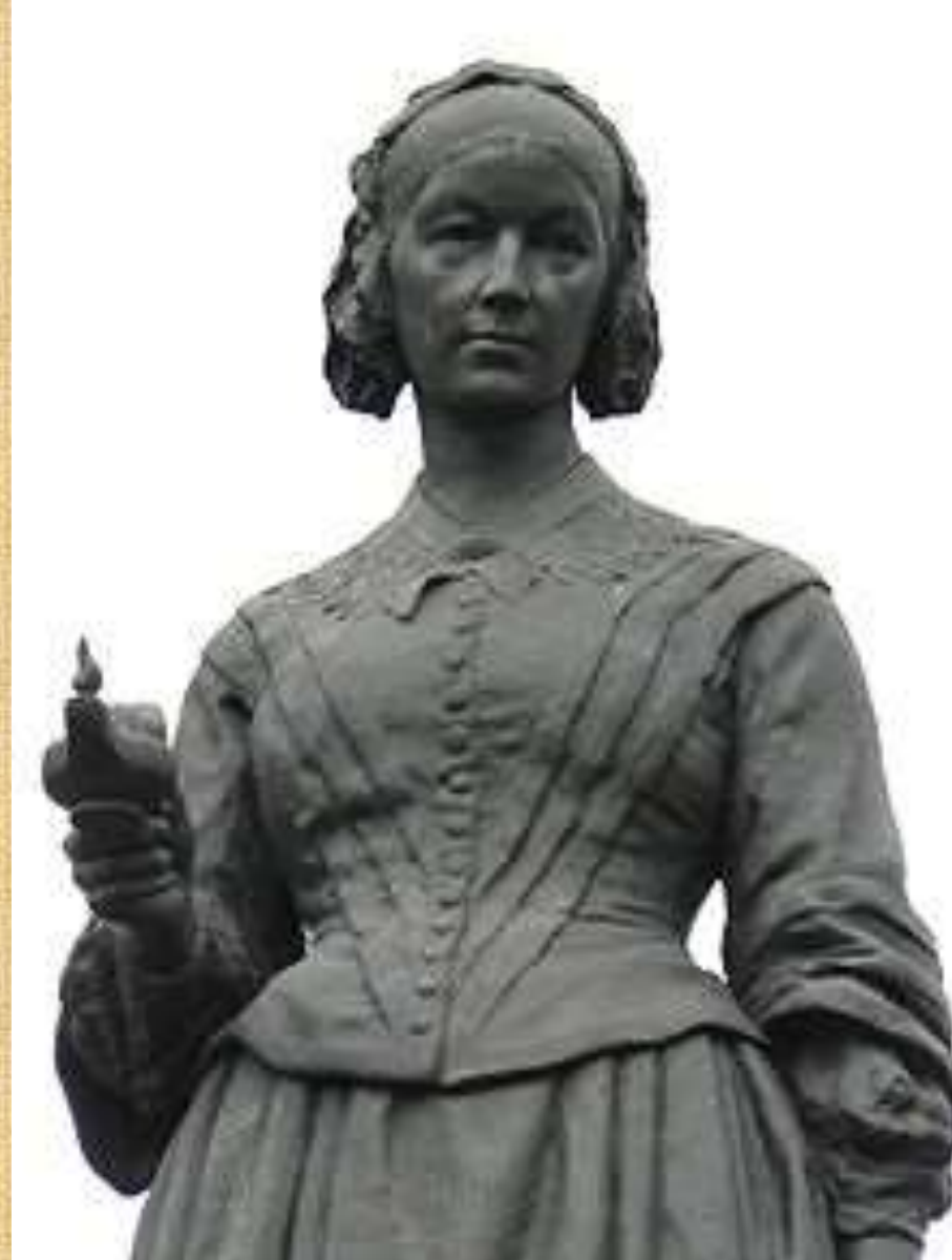
Памятник Флоренс Найтингейл