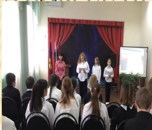
Классные часы «Безопасность в сети интернет» (6 кл.)