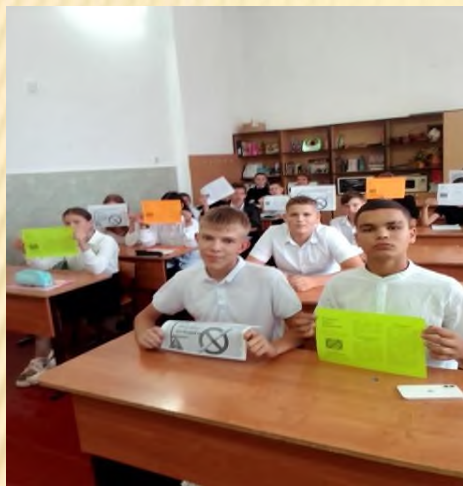
Классные часы «Я выбираю ЗОЖ» (7-8 кл.)