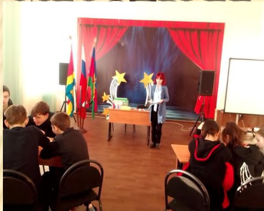
Проведение Правовых игр «Имею право, но обязан» ( 8 классы)