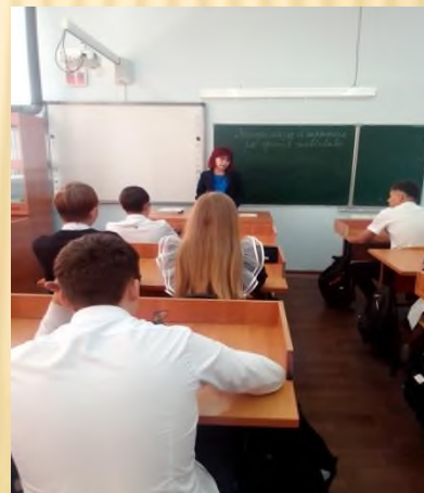
Профилактические беседы «Экстремизм и терроризм-зло для человечества»