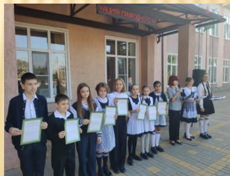
Подведение итога конкурса «Я выбираю ЗОЖ» (5-6 кл.)