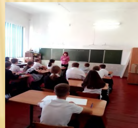
Классные часы «Подросток и закон» (9 кл.)