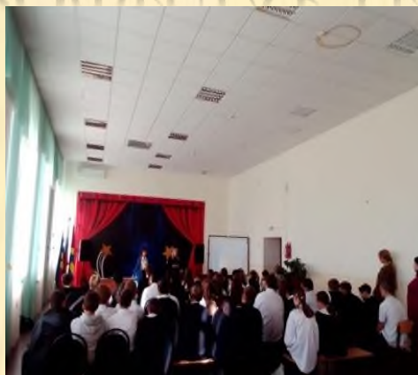
Круглый стол « Уголовная и административная ответственность несовершеннолетних» (9 кл.)