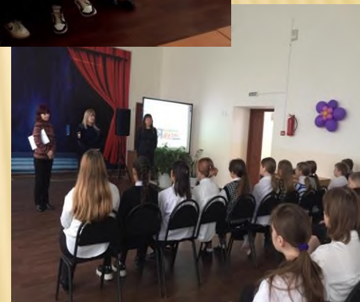
Круглый стол «Влияние курения, алкоголя, употребления психотропных и наркотических веществ на организм человека»