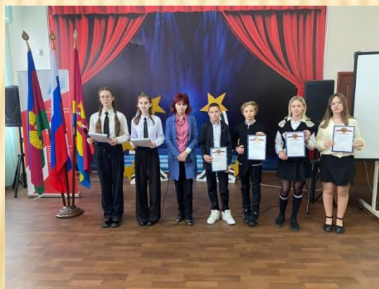
Итоги конкурса плакатов «Нет насилию в школе»( 5-9 кл.)