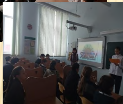
Профилактические беседы «Я выбираю жизнь»