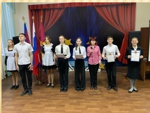
Итоги конкурса плакатов «Нет насилию в школе»( 5-9 кл.)