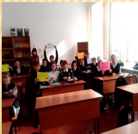
Беседа-лекция «Вредные привычки» (8-9 классы)