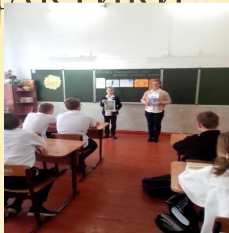
Беседы-лекции, приуроченные ко Всемирному дню правовой помощи детям (7-8 кл.)