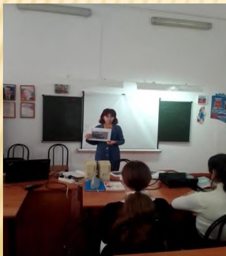
Профилактические беседы на тему: «Экстремизм в молодежной среде» (7-8 кл.)