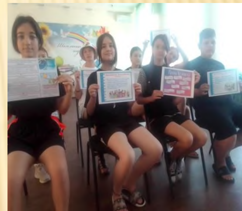
Проведение викторины «Я имею право» ( 6 кл)