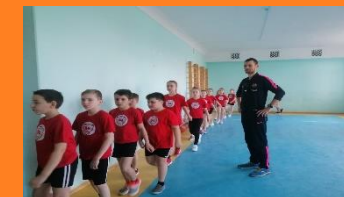
Проведение открытых уроков по реализации ФГОС НОО

Выступления, участие на районных методических объединениях, в научно-практических конференциях