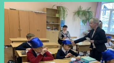
Фестиваль открытых уроков, мастер-классов по реализации ФГОС