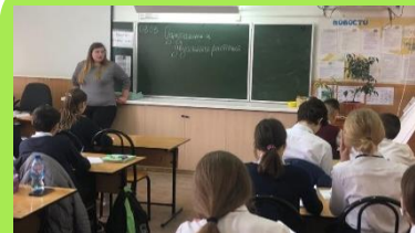
Панорама открытых уроков «Молодые – молодым»