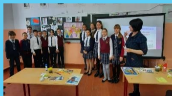
Единый методический день