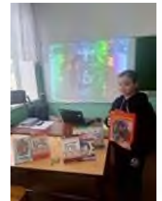
Мероприятие в рамках совместного проекта с библиотекой п. Консервный завод «Традиции празднования Рождества на Кубани»