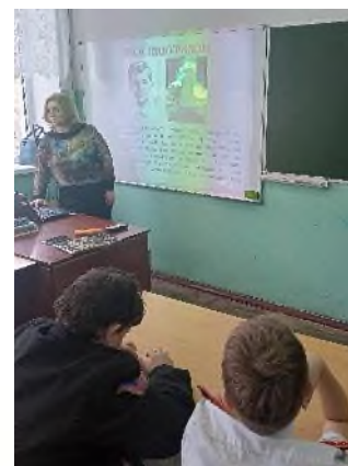
Классный час в рамках совместного проекта с библиотекой п. Консервный завод «Дети – кубанцы - герои ВОВ».