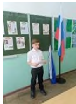
Урок мужества «День взятия турецкой крепости Измаил русскими войсками под командованием Суворова А.В.»