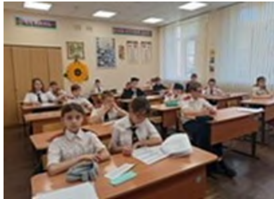
Участие во Всероссийской патриотической общественно-просветительской акции «Казачий диктант»