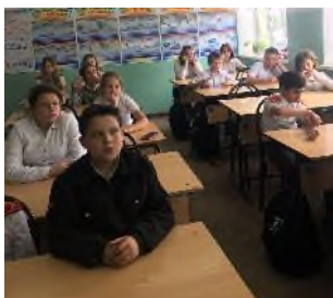
Классный час «День реабилитации Кубанского казачества»