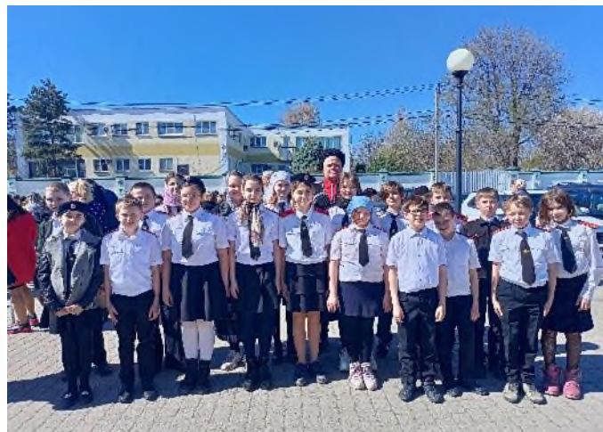
Мероприятия с участием Динского хуторского казачьего общества и юных казачат