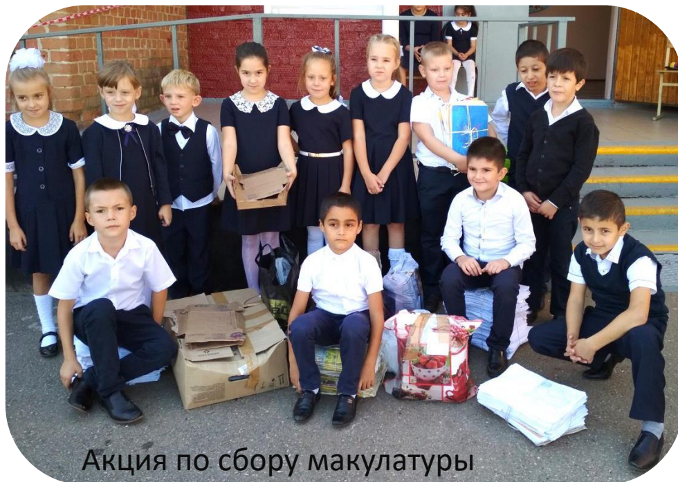
Акция по сбору макулатуры