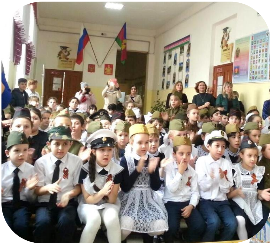
Конкурс патриотической песни