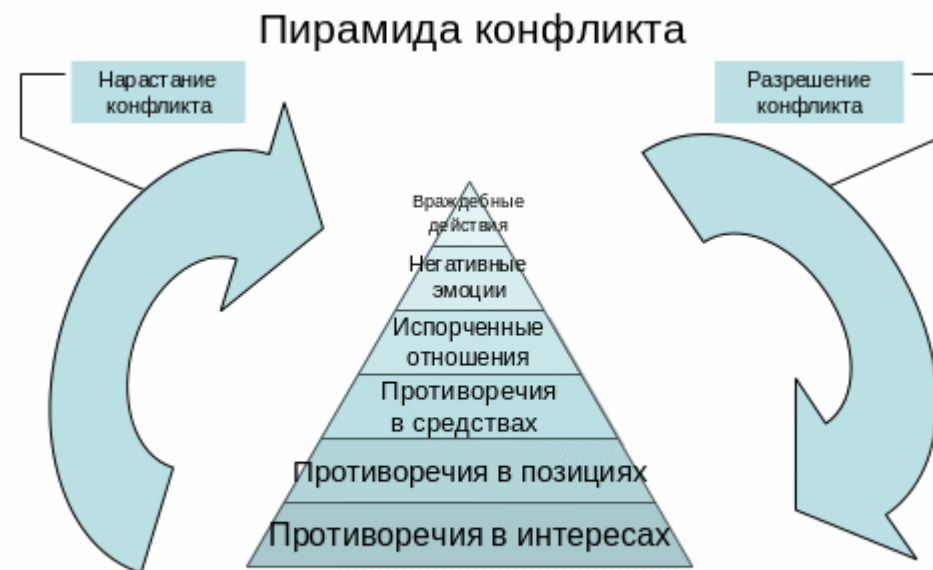
Этапы эскалации и разрешения конфликта