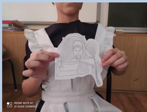
Рисунок ученицы 6 класса к балладе В.А.Жуковского «Светлана»

При изучении романа А.С. Пушкина «Дубровский» перед детьми можно поставить такие вопросы, которые требуют неоднозначного ответа: Нужно ли было Владимиру Дубровскому отказывать Троекурову, когда тот после суда шел мириться? Любила ли Маша Дубровского?